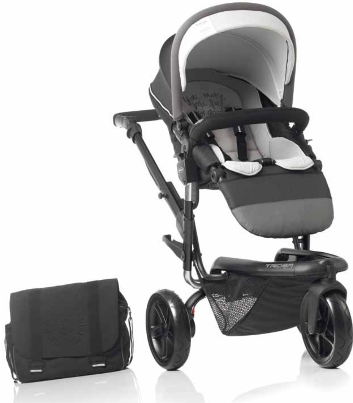
5324 R17 SHADOW