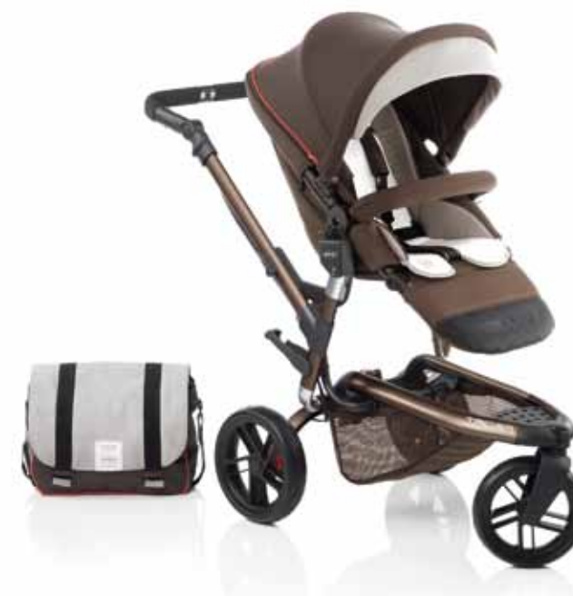
5324 R16 BOHEME