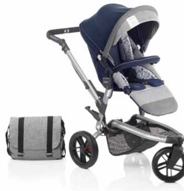
5324 R12 BLUE MOON